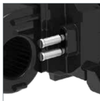
Heater fittings 16 mm