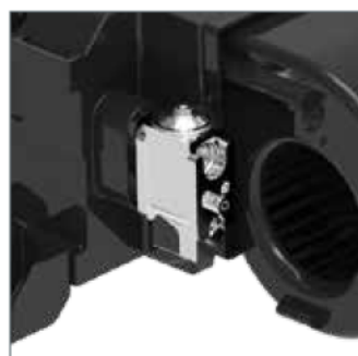
Flange expansion valve